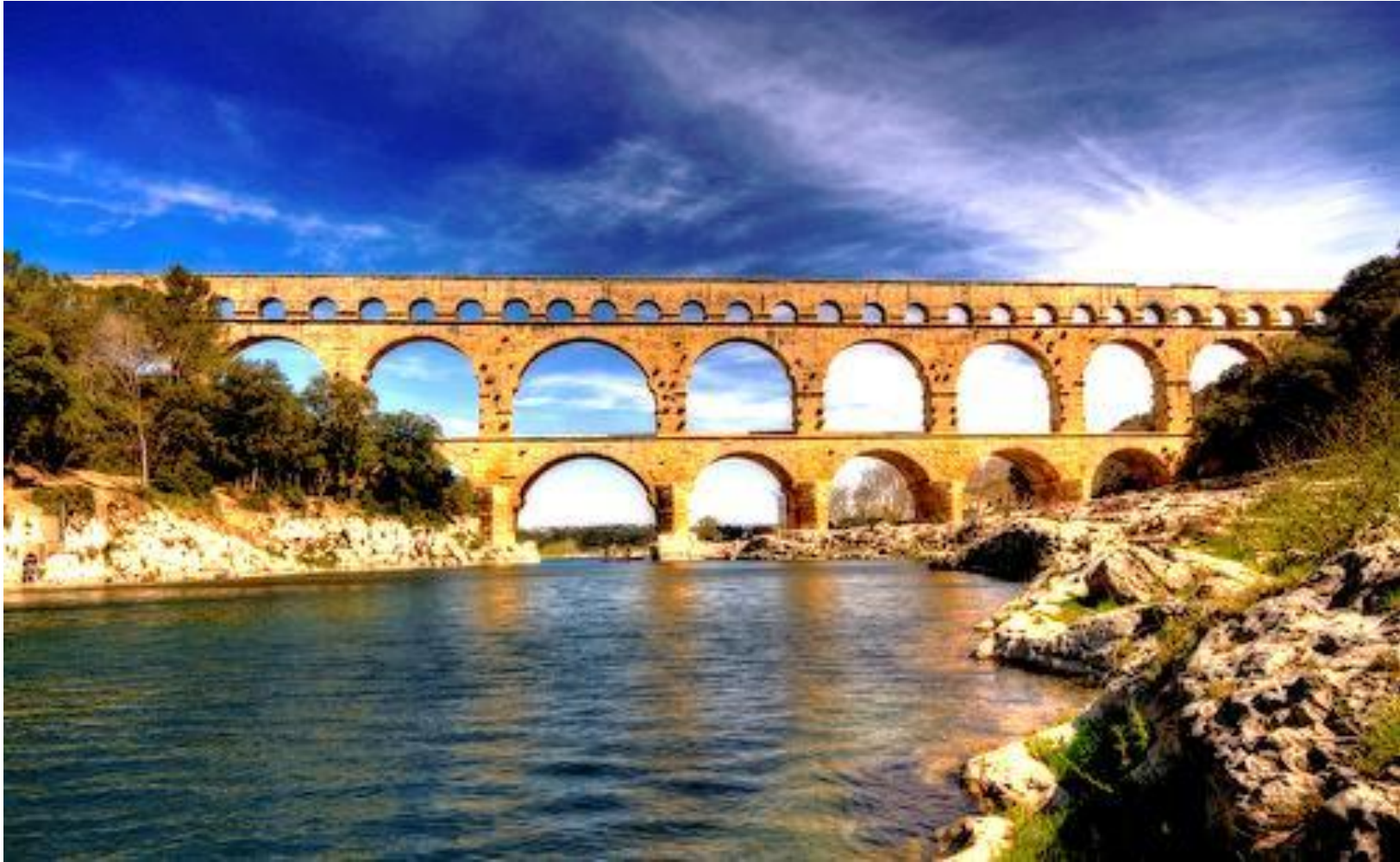
Le pont du Gard